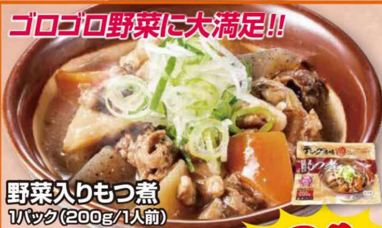
野菜入りもつ煮 1パック(200g/1人前)