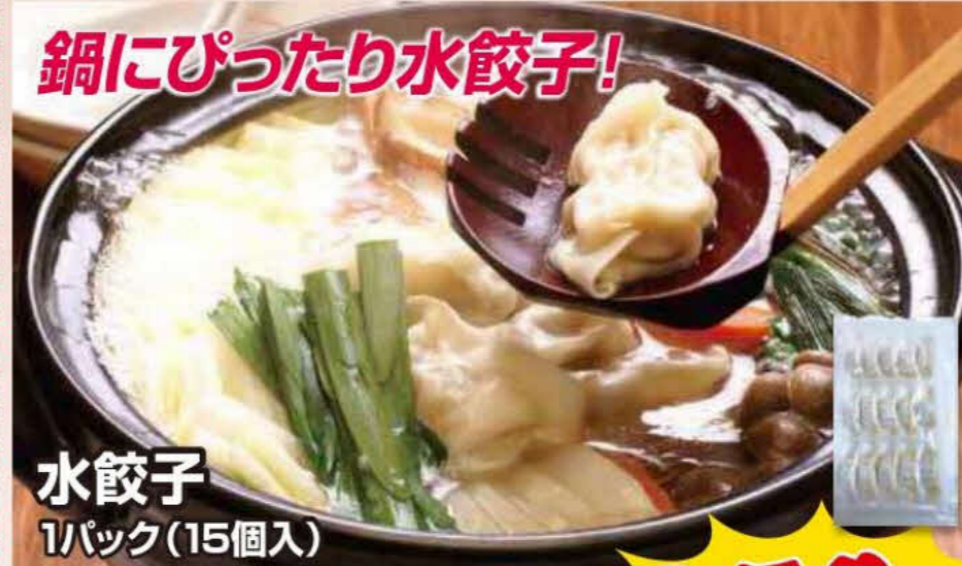
水餃子 1パック(15個入)