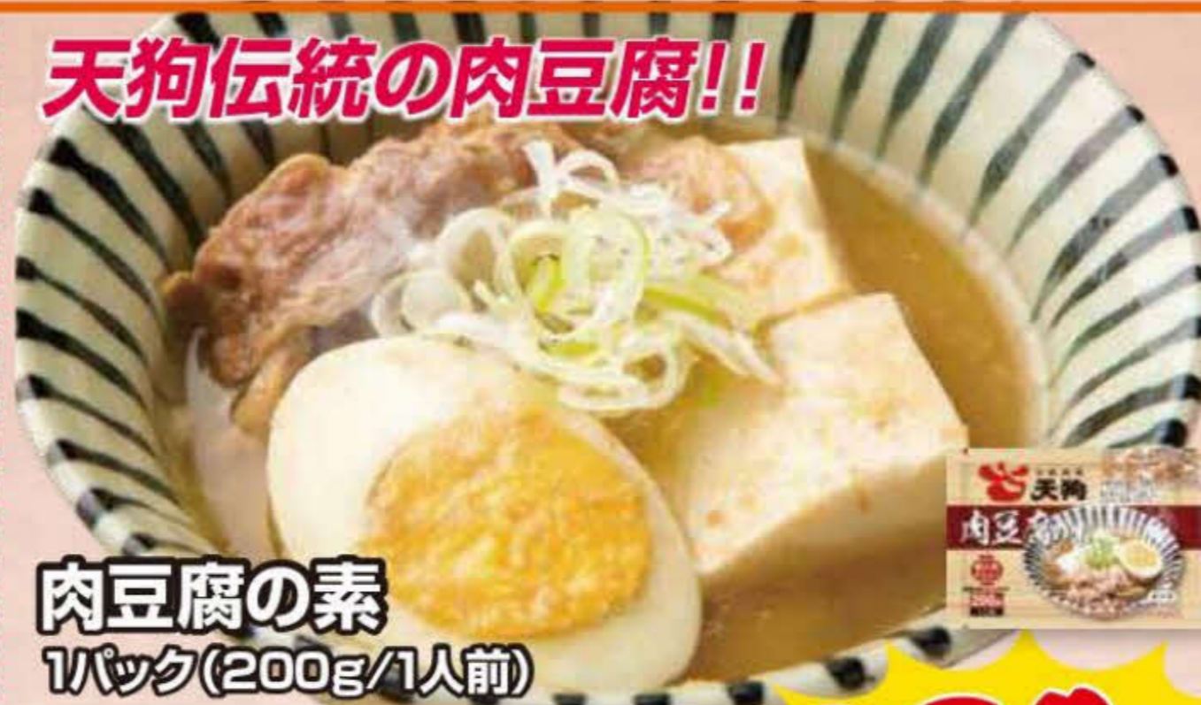
肉豆腐の素 1パック(200g/1人前)

創業当時から受け継がれる伝統の肉豆腐。(豆腐とゆで卵は「肉豆腐の素」には入っておりません。)