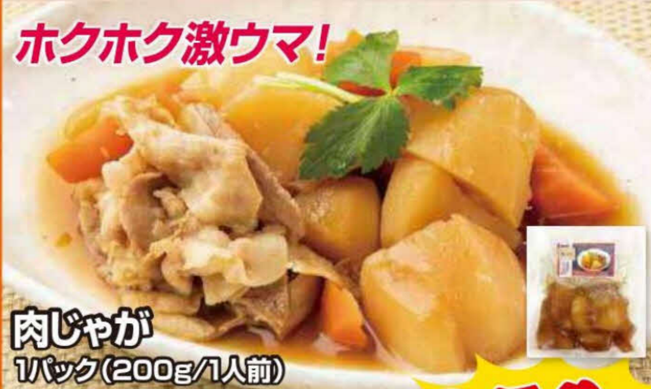
肉じゃが 1パック(200g/1人前)

生のじゃがいもから調理しているこだわりがこのほくほく感を生み出します! 本格煮物を召し上がれ!!