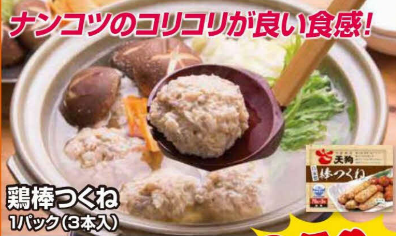
鶏棒つくね 1パック(3本入)

軟骨の食感がクセになる! お鍋の具材としてはもちろん、ハンバーグや肉豆腐などアレンジもいろいろ!