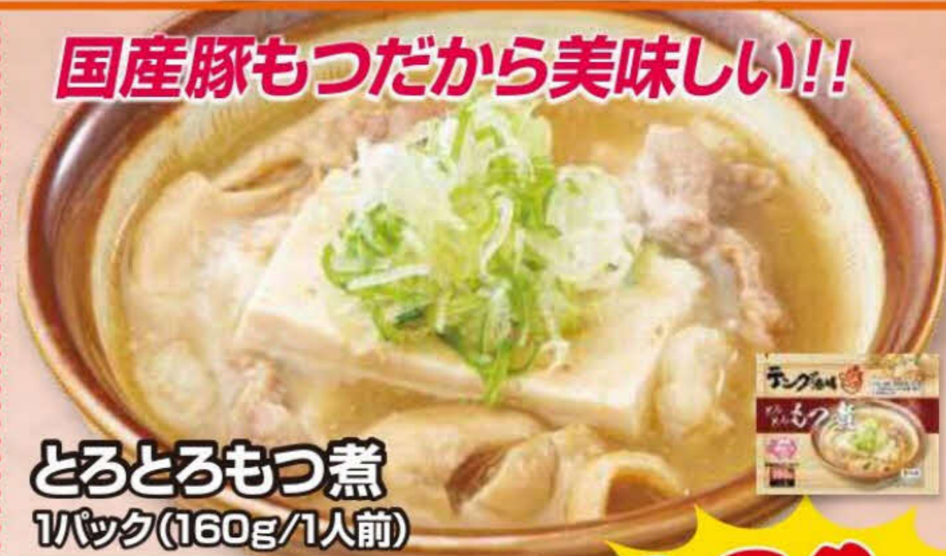
とろとろもつ煮 1パック(160g/1人前)

とろ皮、背脂、国産野菜の旨みがじっくり溶け込んだ自家製・濃厚もつ煮込みです(豆腐は「とろとろもつ煮」には入っておりません。)